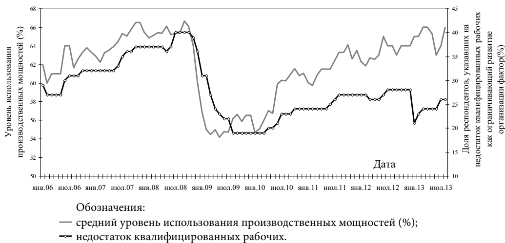
Рис. 2. Динамика факторов, ограничивающих рост производства в обрабатывающей промышленности (индикаторы загрузки производственных мощностей и дефицита труда).

График рис. 2 интересен тем, что он показывает доступность факторов производства. Несмотря на высокие показатели занятости, что позволило российскому министру финансов утверждать о наличии перегрева в экономике, острота проблемы дефицита квалифицированного труда, существовавшая в предкризисный период, заметно спала, в то время как загрузка производственных мощностей приближается к предкризисной. Это можно интерпретировать как потенциальный спрос