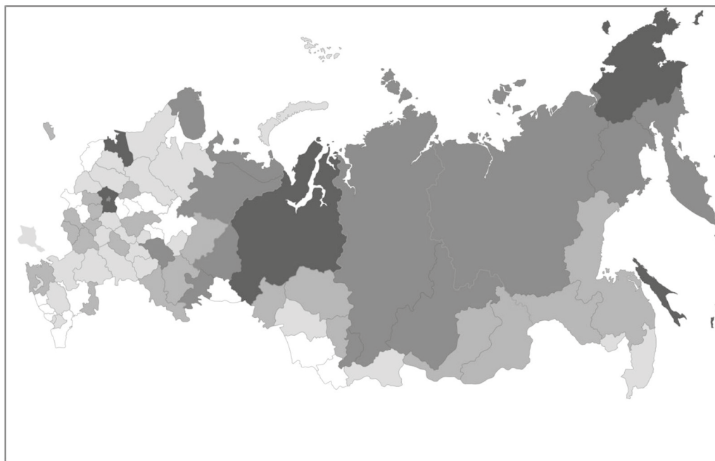
Рис. 2. Распределение регионов РФ по покупательной способности заработной платы учителей

Примечание: черным цветом выделены регионы с высокой покупательной способностью, серым — со средней покупательной способностью, белым — с низкой покупательной способностью, темно-серым — с высокой или средней покупательной способностью, светло-серым — регионы с низкой или средней покупательной способностью.