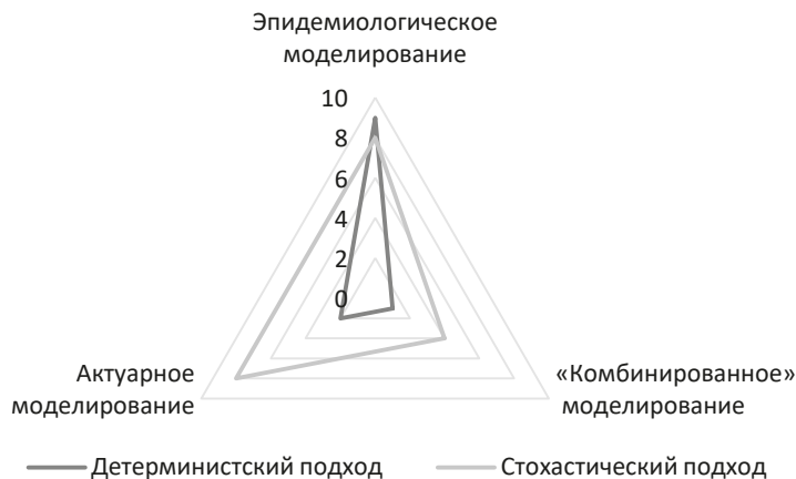
Рис. 2. Результаты анализа научной литературы по проблематике исследования рисков биологических угроз, в разрезе подхода к исследованию

Рис. 2 демонстрирует, что эпидемиологические исследования при оценке рисков используют преимущественно детерминистские модели, тогда как в актуарных расчетах применяются преимущественно стохастические.