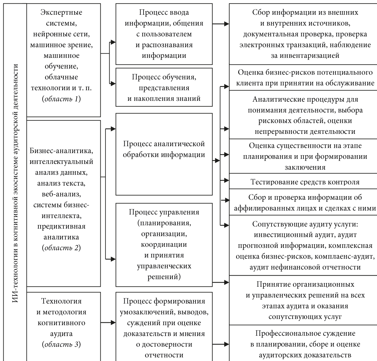
Рис. 4. Применение ИИ-технологий экосистемы аудиторской деятельности для решения прикладных задач в аудите

проверки за счет многократного повышения объема обработанной информации в единицу времени. Аудиторские фирмы стран «Big 4» оценивают экономический эффект от внедрения когнитивных технологий в сокращении трудоемкости сбора и обработки информации в 50 %. Роботизированные технологии способны считать 800 млн страниц в секунду, суммировать данные практически мгновенно. ИИ-аудит, с одной стороны, создает возможность ускорения процессов обработки информации, а с другой стороны, позволяет повысить качество и результативность проверки за счет применения методов анализа данных и распознавания текста документов.