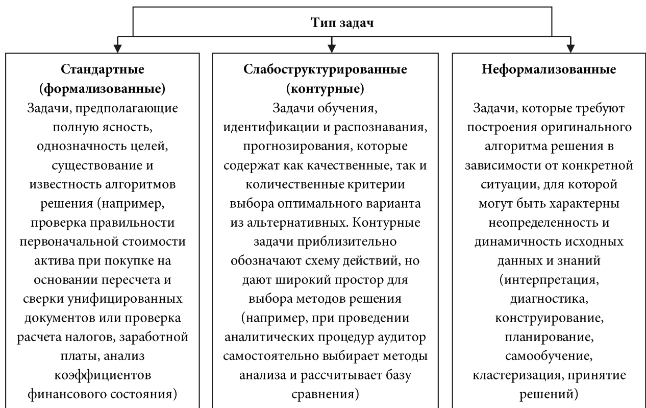
Рис. 1. Типы задач в аудите

Анализ и обобщение подходов зарубежных авторов к процессам и когнитивным задачам в аудите позволили структурировать их типы с учетом принимаемых решений (рис. 1). Следует отметить, что стандартность и структурированность задач в данном случае весьма относительны, поскольку алгоритм их реализации далеко не всегда известен и четко определен внутрифирменными стандартами организации.