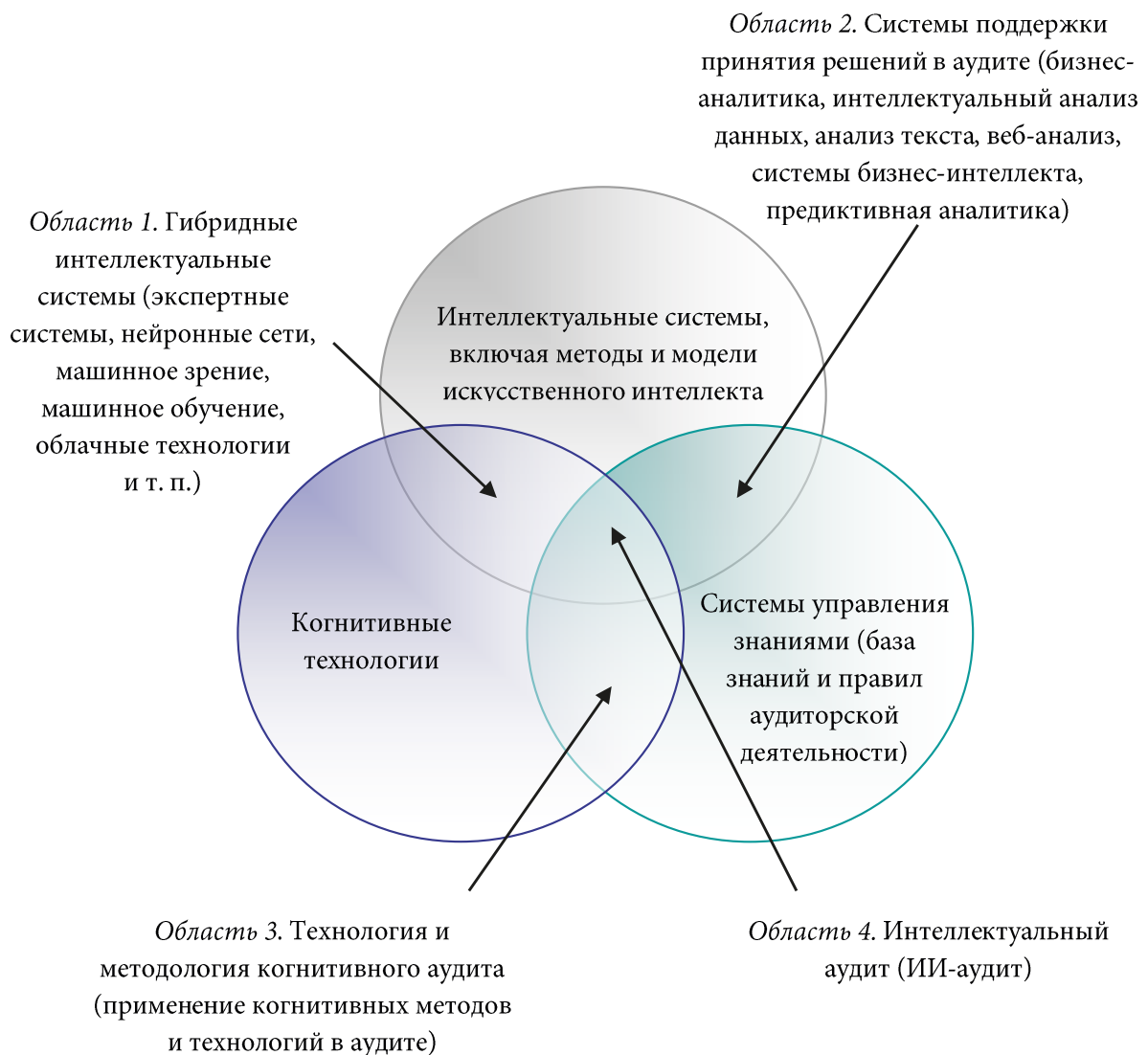
Рис. 3. Структура когнитивной экосистемы аудиторской деятельности

Рассматривая структуру когнитивной экономической системы, Н. М. Абдикеев, А. Н. Аверкин, Н. А. Ефремова отмечают, что она включает в себя: область применения интеллектуальных (когнитивных систем), основанных на методах и моделях искусственного интеллекта, систем поддержки принятия решений и интеллектуальной обработки данных; область управления знаниями (на основе методов нейрофизиологии, психологии и т. п.); область применения когнитивных технологий [Абдикеев, Аверкин, Ефремова, 2010]. Принимая во внимание данный подход, позволяющий определить взаимодействие применения ИИ-технологий для конкретной предметной области, предлагается структура когнитивной экосистемы аудиторской деятельности (рис. 3).